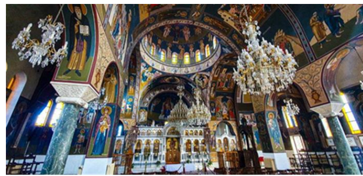
Το εσωτερικό του Ι.Ν. Αποστόλου Ανδρέα

Ενημερωτικό Δελτίο του Συνδέσμου των Απανταχού Καρυατών